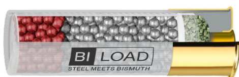
BI-LOAD 12/76 HP MAGNUM 40g

8 g di pallini in bismuto da 3,8mm (N°2) + 32 g di pallini di ferro dolce da 3,5mm (N°3) = 40 g di potenza pura senza piombo