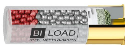
BI-LOAD 12/70 HP 36g

8 g di pallini in bismuto da 3,8mm (N°2) + 32 g di pallini di ferro dolce da 3,5mm (N°3) = 40 g di potenza pura senza piombo